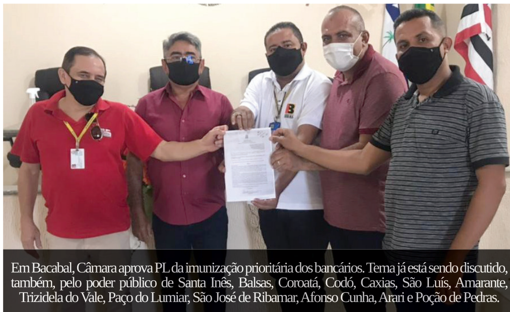
Em Bacabal, Câmara aprova PL da imunização prioritária dos bancários. Tema já está sendo discutido, também, pelo poder público de Santa Inês, Balsas, Coroatá, Codó, Caxias, São Luís, Amarante, Trizidela do Vale, Paço do Lumiar, São José de Ribamar, Afonso Cunha, Arari e Poção de Pedras.