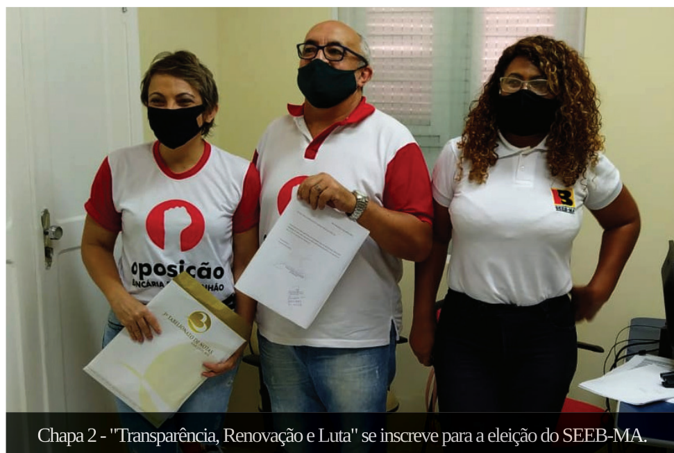
Chapa 2 - "Transparência, Renovação e Luta" se inscreve para a eleição do SEEB-MA.