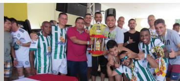
Basa: vice-campeão livre