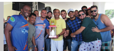
Itaú: terceiro lugar livre