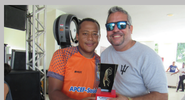
Melhor defesa: Caixa Forte e Basa/Bradesco