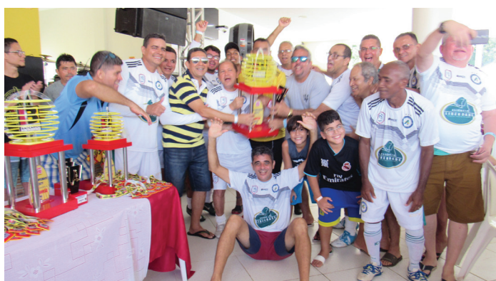
Time do Basa/Bradesco comemora o título de campeão da categoria master!