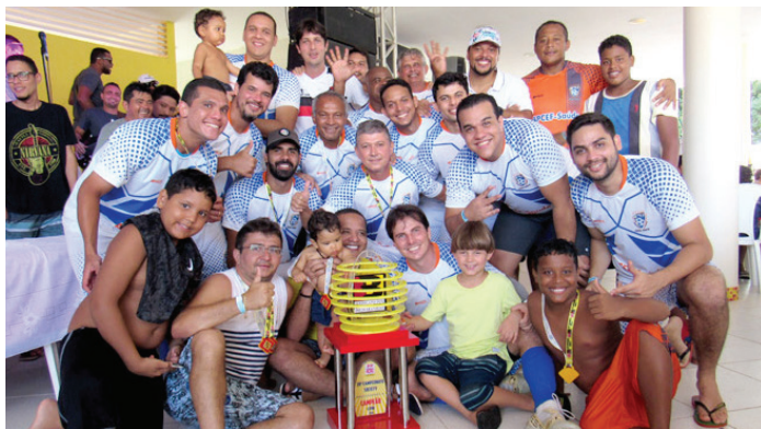
Time da Caixa Forte comemora o título de campeão da categoria livre!