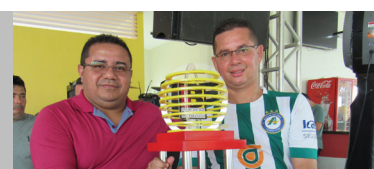
BB: terceiro lugar master