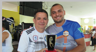
Melhor defesa: Itaú