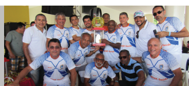
Caixa Forte: vice-campeão master