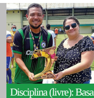
Disciplina (livre): Basa