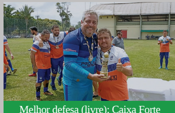
Melhor defesa (livre): Caixa Forte