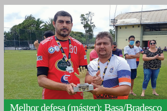
Melhor defesa (máster): Basa/Bradesco