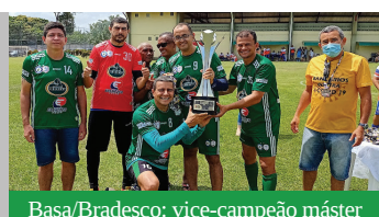
Basa/Bradesco: vice-campeão máster