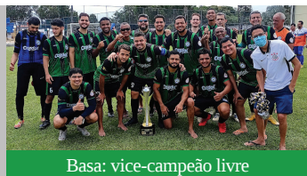
Basa: vice-campeão livre