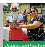
Disciplina (máster): Caixa Forte