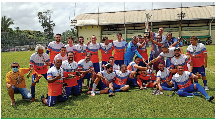
Time do Caixa Forte venceu o Basa por 6 X 2 e comemorou o título de campeão da categoria livre!