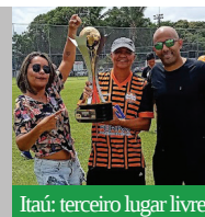
Itaú: terceiro lugar livre