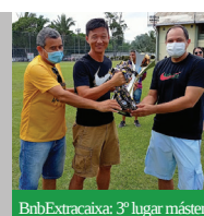
BnbExtracaixa: 3º lugar máster