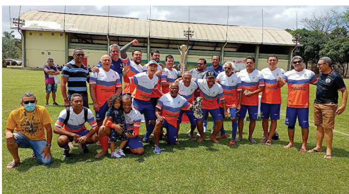
Caixa Forte bateu o Basa/Bradesco por 3 x 1 e faturou, também, o título de campeão da categoria máster!