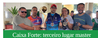
Caixa Forte: terceiro lugar master