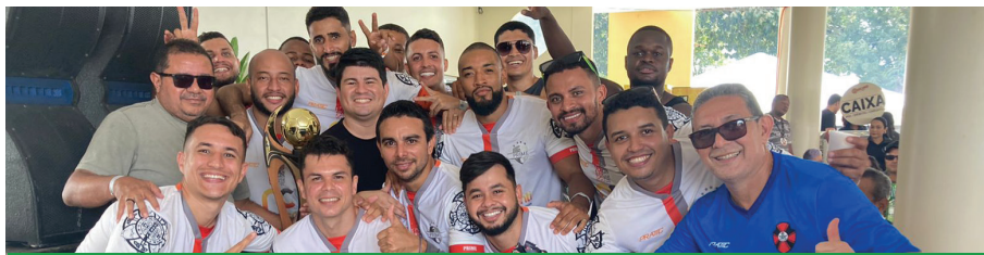
Bradesco Prime venceu o Caixa Forte nos pênaltis e comemorou o título de campeão da categoria livre!