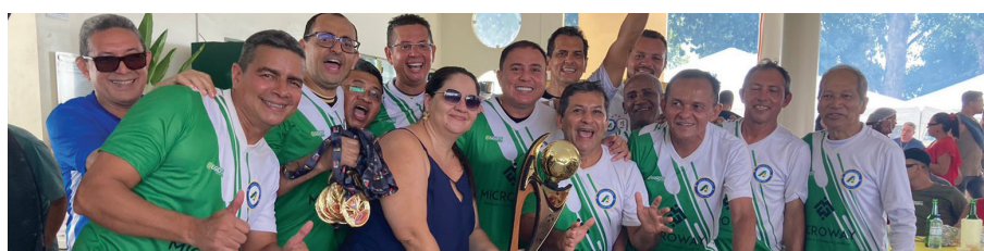
Basa fez 2 x 1 no Caixa Forte e faturou a taça de campeão na categoria cinquentão!