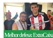
Melhor defesa: ExtraCaixa