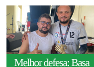
Melhor defesa: Basa