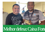
Melhor defesa: Caixa Forte