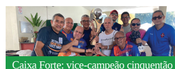
Caixa Forte: vice-campeão cinquentão