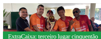
ExtraCaixa: terceiro lugar cinquentão