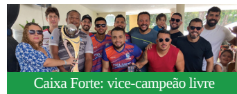
Caixa Forte: vice-campeão livre