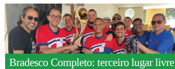
Bradesco Completo: terceiro lugar livre