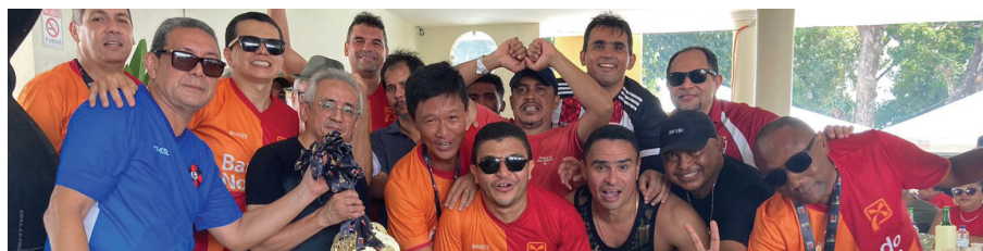
ExtraCaixa derrotou o Banco do Brasil por 2 x 0 e levantou o troféu na categoria master!