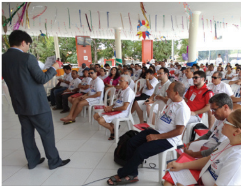
No Encontro, houve, ainda, prestação de contas, reunião com advogados e o Pré-Carnaval.