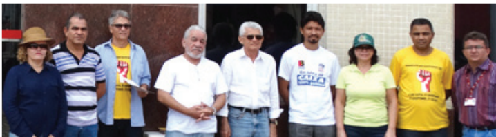
SEEB-MA espera que as circunstâncias desse negócio obscuro entre o Governo Roseana Sarney e o Bradesco sejam apuradas.

O SEEB-MA realizou um ato público no dia 10/02, em frente ao "Bradesco", no Centro de São Luís, para marcar os 11 anos da privatização do Banco do Estado do Maranhão.