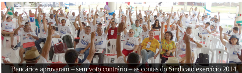
Bancários aprovaram – sem voto contrário – as contas do Sindicato exercício 2014.

E m assembleia realizada no sábado (31/01), na sede recreativa do SEEB-MA, em São Luís, os bancários maranhenses aprovaram – sem voto contrário – as contas do Sindicato referentes ao exercício 2014.