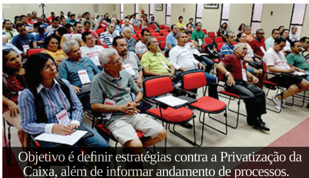
Objetivo é definir estratégias contra a Privatização da Caixa, além de informar andamento de processos.

O SEEB-MA convida os bancários da Caixa Econômica Federal para a assembleia que será realizada na quarta-feira (25/02) às 18h, na sede do Sindicato, em São Luís.